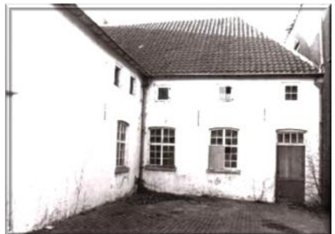
de "Oude Kluis" van Huize Padua voor de restauratie 1990.

De Kluis raakt intussen in verval. Het oude gebouw is een tijdlang in gebruik als schilders- en schoenmakerswerkplaats van "Huize Padua" De laatste bestemming was opslagplaats. Intussen is het in treurige staat. De buitenkant ziet er nog wel aardig uit, met "ingelijst" stucwerk, typische ramen, de rode pannen. Binnenin is het een ruïne. Achter de voordeur is een verrotte balk provisorisch gestut. Maar een muurtje erboven is toch ingestort. En de stenen kunnen elk moment naar beneden komen. Een paar machines herinneren aan de schoenmakerswerkplaats.